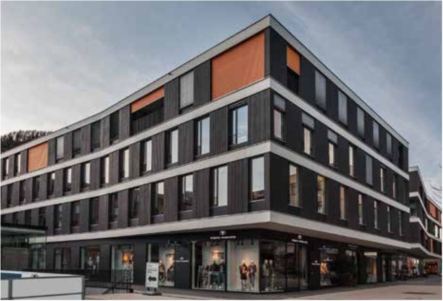
APS Büro in Götzis, Vorarlberg.